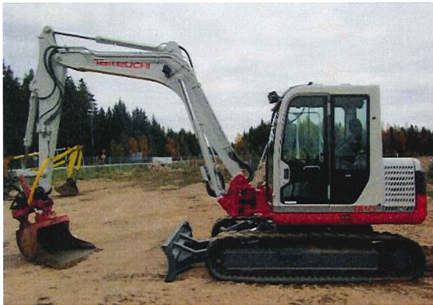
TAKEUCI 4,5 T

Hasses All-tjänst erbjuder våra medlemmar olika tjänster inom entreprenadbranschen och då främst inom grävning. Hasse har mångårig erfarenhet inom entreprenadarbeten och har en 4,5 tons grävare